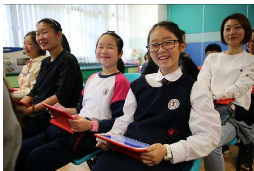
家校齊心推動「BYOD 學習計劃」