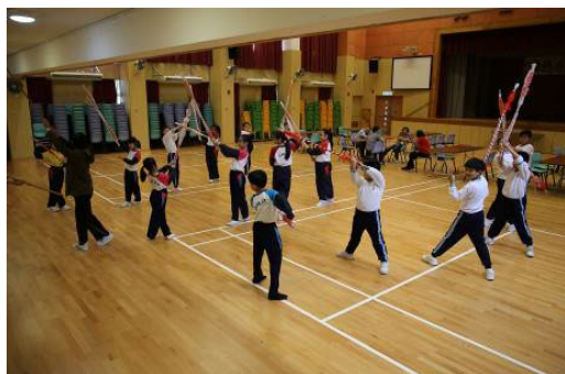
「粵藝樂童心」粵劇實踐計劃

爲了豐富學生的學習活動，促進學生的身心健康，學校開展達六十多個興趣小組，包括英語小偵探、拉丁舞、手鐘手鈴、水墨畫、天才小廚神、中英文話劇、普通話小DJ、揚琴、綜合藝術、Theme-based English Activity、Puppet Theatre、Living English Adventure、English Drama、古箏、中國鼓、簡易田徑、趣味奧數培訓課程、奧林匹克數學培訓課程、羽毛球、乒乓球校隊、花式跳繩進階班、籃球校隊、花式跳繩精英班、古典詩詞書畫班、普通話說故事、中國鼓高班、二胡、琵琶/阮/柳琴、爵士舞、武術、小型網球、小領袖訓練、資優解難培訓課程、英語大使資優班、Lego Buddies等，學生積極參與，發揮個人潛能，並透過參與比賽，發揮學生在學術、藝術和體育等方面的優異潛能。