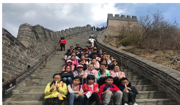
北京姊妹學校交流： 遊學大使在長城上唱奏《龍的傳人》