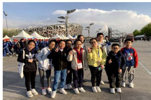
音樂大使積極於校園內外推廣音樂，還到訪北京的姊妹學校交流。