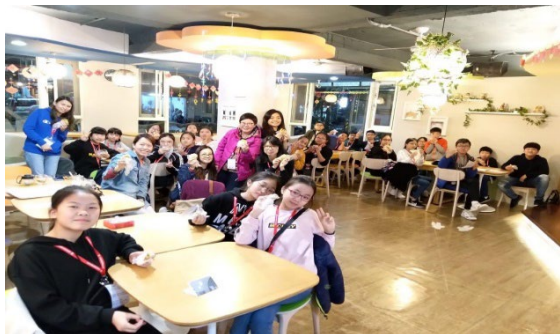
帶着童書去遊學—台北生命教育之旅

本校課程以學生為本，積極為學生提供多元學習經歷，包括全方位學習、資優培訓、自主閱讀等，讓每個學生透過體驗、探索，打下穩健的學術基礎。