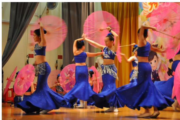
校際舞蹈節比賽獲中國舞甲等獎