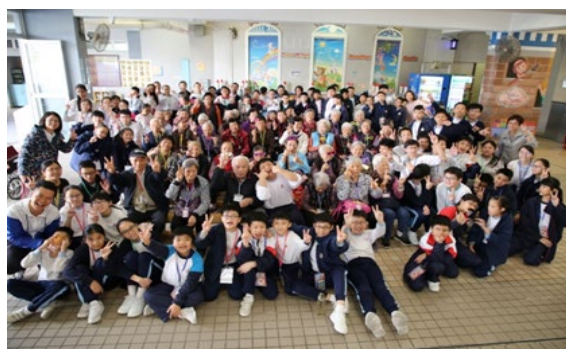
六年級社區關懷活動：來！一起！我們的老友記