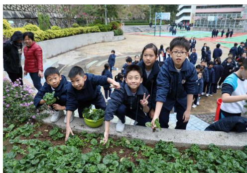
校園小園丁：我們的白菜收成了！

透過全面而有系統的「關愛校園」計劃，我們深信能發掘學生潛能，培養學生愛惜自己、關心別人，並把關愛精神延展至社區、祖國以至全世界。學校注重培養學生良好品德，建立正確的價值觀，除推行「環保」教育，提倡愛護環境外，還透過各項「健康校園」計劃，鼓勵學生養成良好的健康生活習慣，追求健康的人生。