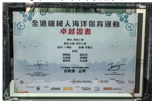
全港機械人海洋保育運動挑戰賽金獎