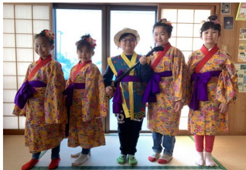
日本沖繩 STEM 科技文化交流