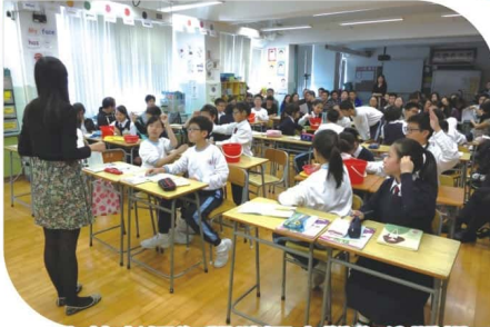
本校老師為觀塘區小學作公開課