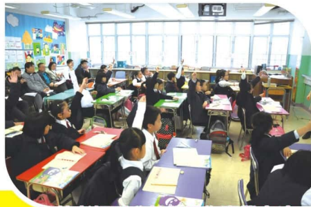
友校老師到我校觀課作專業交流