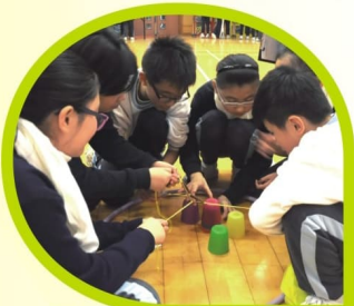
齊心協力，砌好彩杯金字塔！