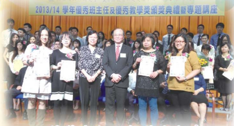
2013/14 學年優秀班主任及優秀教學獎頒獎典禮暨專題講座