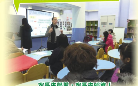
家長來學習，家長來服務！