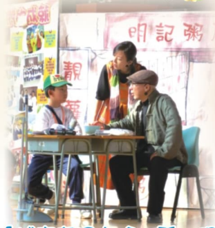
「城市奇遇之珍·聽·明」