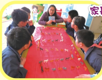
大家都充滿學習的自信心！