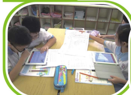
利用平板電腦進行活動， 提升學習興趣。