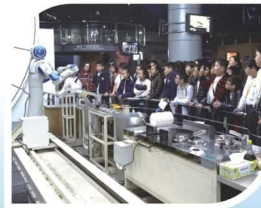
機械人示範烹飪令同學大開眼界