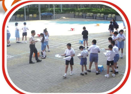
同學們走出課室，在操場上進行學習活動。