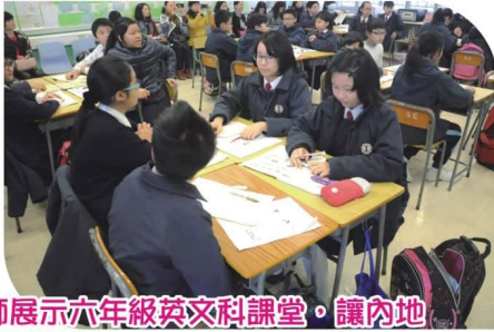
老師展示六年級英文科課堂，讓內地 教師更了解本港的英語學習情況。

佛山市順德區小學英語教師到 我校進行交流活動，除了解我校的 發展外，亦參與觀課活動。