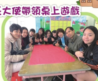
家長們把自己所學回饋學生，謝謝你們！