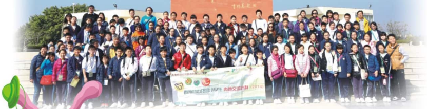
參觀東莞供水工程

為了持續提供全方位的體驗式學習活動，我校參加了「同根同心」-內地交流計劃。六年級學生參加「東莞的發展與規劃」2天交流團，參觀了東莞科學技術博物館、東莞展覽館、東莞圖書館及松山湖科技產業園區等地方，擴闊視野。