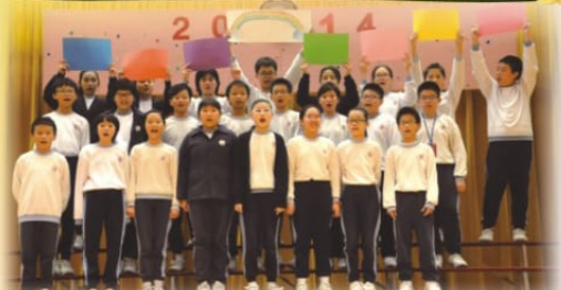
同學們認真地表演