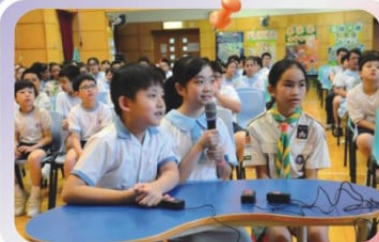
國民常識問答比賽