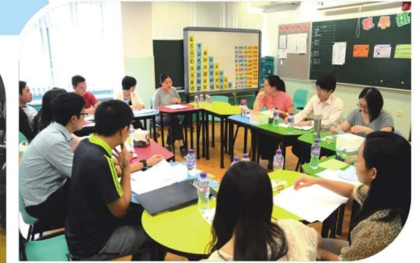
老師觀課後就課堂作深入探討