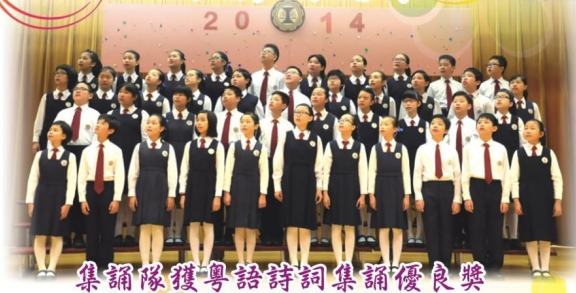
集誦隊獲粵語詩詞集誦優良獎

我校參加第六十六屆香港學校朗誦節比賽，同學積極練習，英文組、粵語組及普通話組合共奪得55項佳績。