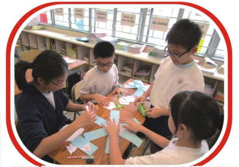
同學們合力製作立體圖形的摺紙圖樣