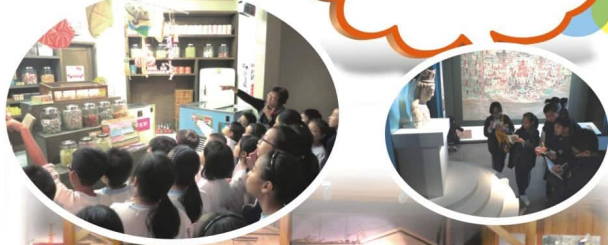
四年級同學到香港歷史博物館認識香港今昔