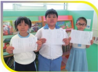
大功告成！看誰寫得最漂亮？