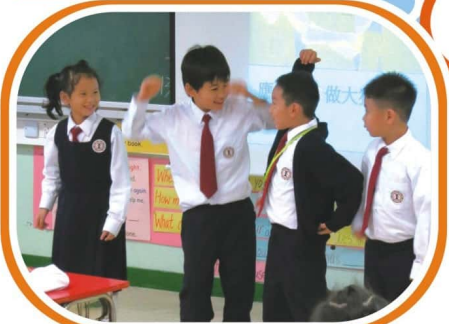
課堂滲入戲劇元素提升學生閱讀興趣

本校老師利用不同的教學 策略，為學生營造愉快的 學習環境，提升學習興趣 和效能。