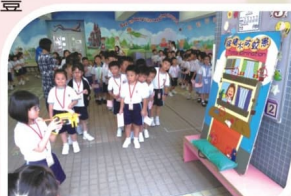
「消毒水·防蚊患」攤位遊戲