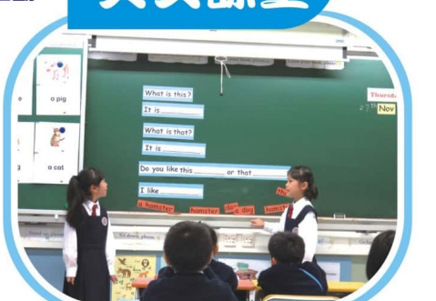
靈活運用英語，建立說話信心。