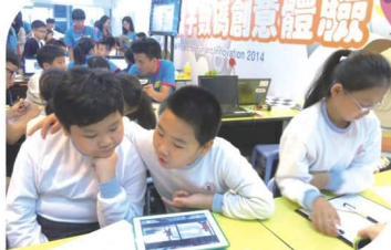
同學正學習運用電腦程式編製動畫