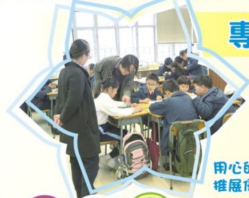
用心的教學設計，推展優質的課堂。