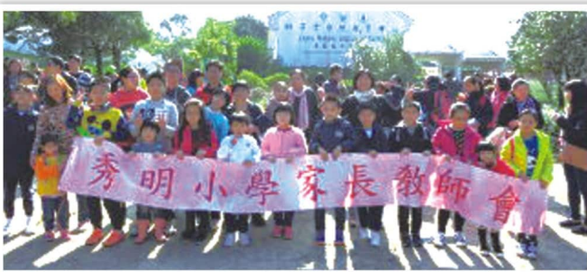
獅子會自然教育中心

為了加強家長與學校之間的聯繫，家長教師會舉行「西貢蕉坑親子樂」旅行活動，行程包括：蕉坑獅子會自然教育中心、西貢碼頭、將軍澳單車館，家長們反應熱烈，參加人數踴躍。