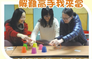
培養學生的第一步，體會學生的學習經歷。