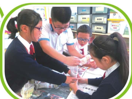
同學們正分組製作污水過濾器