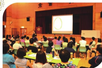
老師們專注地學習及研討