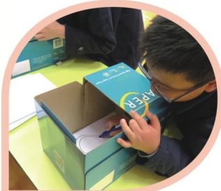
魔鏡魔鏡，怎樣才畫得最靚？