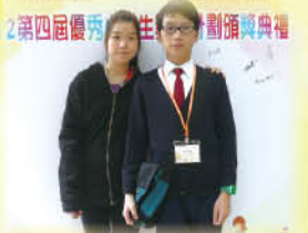
第四屆優秀小學生獎勵計劃頒獎典禮