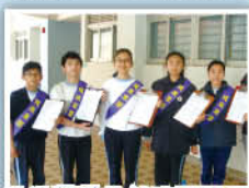
浩浩蕩蕩的健康軍團正準備視察學校環境。

學校對於校園安全十分關注，更有家長義工及由同學組成的「健康軍團」視察校園環境安全，在適當位置加上提示標語，時時刻刻提高同學的安全意識。