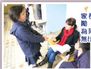
家長們的鼓勵，將會成為同學們的無比動力。