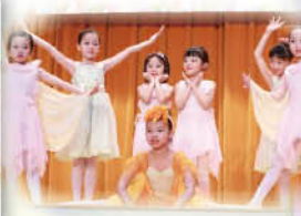
二年級同學投入演出兒童舞《小燕子》。