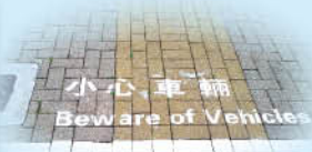
增添安全標語，讓同學更加注意安全。