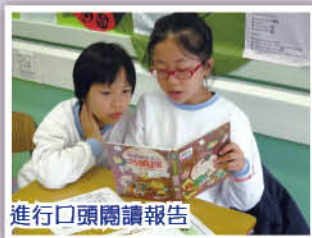
進行口頭閱讀報告

閱讀周讓學生學習前人的智慧，帶動自學的動力、思考和想像，享受進入作者世界的樂趣。學校舉行了書面設計比賽和童話故事欣賞等活動，讓學生感受閱讀的氣氛。