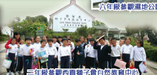
三年級參觀西貢獅子會自然教育中心