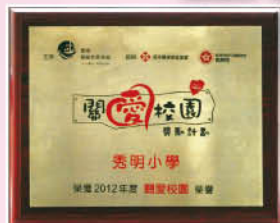
小小獎牌，無限關愛。

本校連續兩年在「關愛校園獎勵計劃」中獲得榮譽，以表揚學校在推動關愛校園的信念、領導及創設的環境。