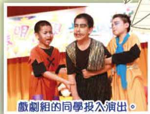
戲劇組的同學投入演出。