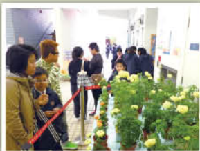
家長日大家共同分享學生的種植成果