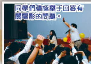
同學們積極舉手回答有關電影的問題。

全校師生齊集學校禮堂，欣賞勵志電影「我的夢」。師生都被影片中那些殘障人士的表演感動了。