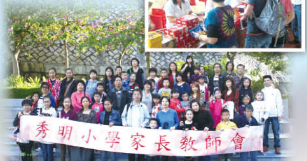
秀明小學家長教師會