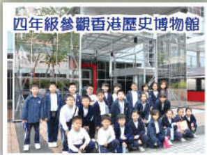
四年級參觀香港歷史博物館