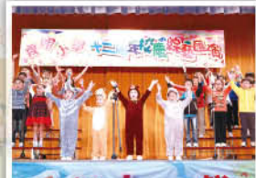
一年級同學合作演出英文唱遊《Go to the Zoo》。