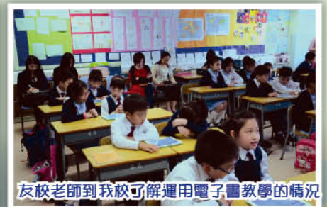
友校老師到我校了解運用電子書教學的情況