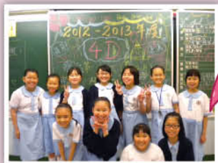
粉筆、黑板和無限創意的同學為生日會增添歡樂氣氛。