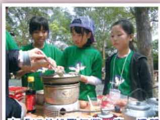
在「戶外挑戰日營」裏，同學們合作炮製美味的健康午餐！