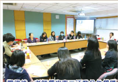
觀課後，老師們均表示活動令他們獲益良多。