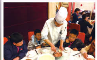
除了參觀名勝古蹟外，親手製作小籠包，也是我們期待已久的活動。