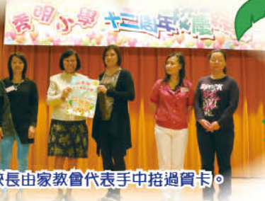
校長由家教會代表手中接過賀卡。