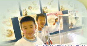
一年級參觀健康食物中心