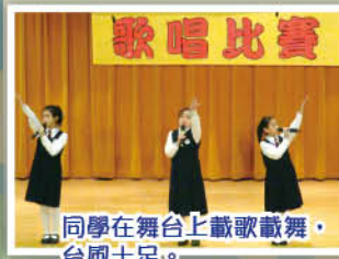
同學在舞台上載歌載舞，台風十足。