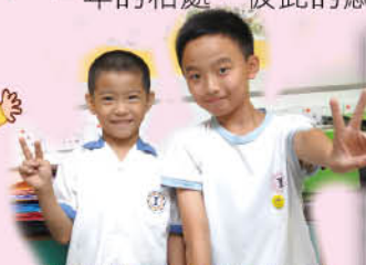
一張張笑臉展示出關愛的力量。