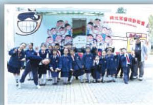
同學們登上「陽光笑容流動教室」學習口腔健康知識。