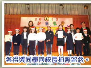
各得獎同學與校長拍照留念。