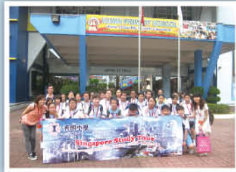
'Sau Ming Explorers'「秀明星探」走進新加坡的學校，得到當地學生熱情的款待，與他們互動交流，結交「新」朋友，參與有趣的課堂活動，親身體驗異地的學習文化。