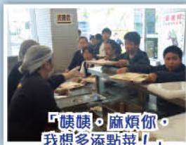
「姨姨，麻煩你，我想多添點菜！」