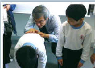
脊科醫生正為同學們進行脊骨檢查。

我校再度參與兒童脊科基金會推動的「護脊運動」，成為了護脊認證學校，在校內宣揚注意脊骨健康的訊息。