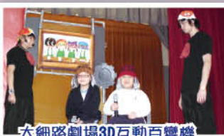
大細路劇場3D互動百變機