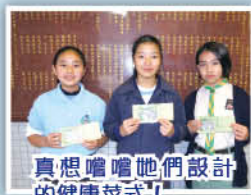
真想嚐嚐她們設計的健康菜式！