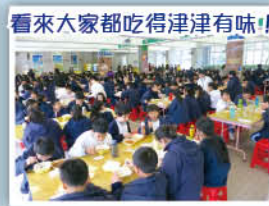
看來大家都吃得津津有味！