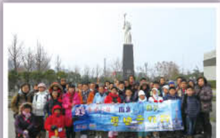
參觀過侵華日軍南京大屠殺遇難同胞紀念館後，我們對國家近代歷史有更深認識，對戰爭的影響也有更深體會。

六年級學生一行40人參加「南京、上海文化交流學習行」。四日三夜的行程讓學生透過參觀活動了解國情和認識中國歷史文化。