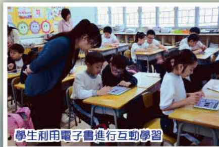
學生利用電子書進行互動學習

我校課程發展與時並進，緊貼教育改革趨勢，務求提升學習興趣與效能。本年度除發展平板電腦教學計劃外，更參與教育局電子書市場夥伴學校計劃。四年級普通話科藉試驗新的學習平台，期望探討進一步推動互動學習的可行性。