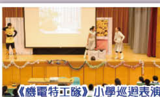
《機電特工隊》小學巡迴表演