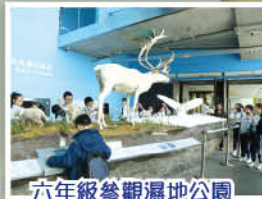
六年級參觀濕地公園