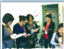
家長義工正認真地紀錄視察報告。