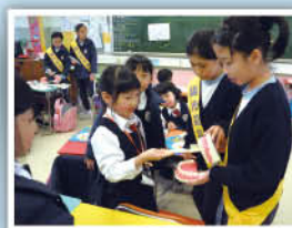
「陽光笑容大使」向小一至小三同學推行口腔健康活動

學校本年繼續參加由衛生署口腔健康教育組推行的「陽光笑容滿校園」行動，訓練高小學生成為「陽光笑容大使」，以朋輩領袖身份，向低小同學推行口腔健康活動。