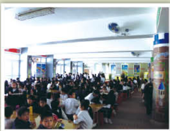
連續五天關燈午膳，一起為環保出一分力。