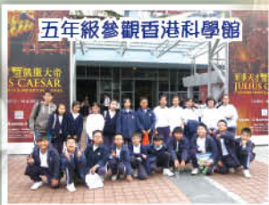
五年級參觀香港科學館