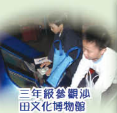
三年級參觀沙田文化博物館