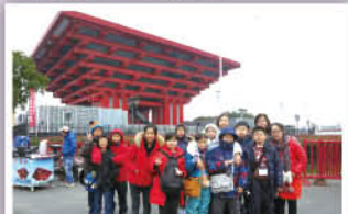
來到上海，又怎會錯過參觀中國館的機會呢！