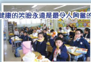
健康的笑臉永遠是最令人興奮的！