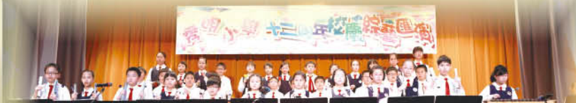
手鈴及敲擊樂演奏《A Festive Peal》。