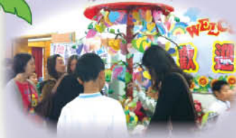
家長及同學在聚精會神地看同學祝賀學校的心意卡。