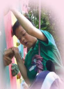
四年級同學在兩日一夜的「再戰營」活動裏，挑戰終極任務——攀上高峰！