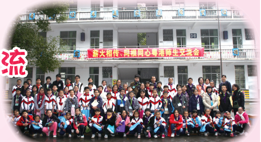
「薪火相傳·同根同心」已由兩地師生的笑臉表現出來。

41位六年級同學於2010年12月9至11日期間，參加了名為「同根同心——連南瑤族農家莊」交流活動。同學們透過體驗農戶的清貧生活及與當地山區學生交流，認識農村生活，感受少數民族發展與文化共融的關連，並加強對祖國的認識。