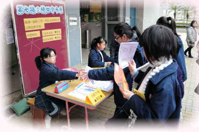
提升中文說話能力的繞口令