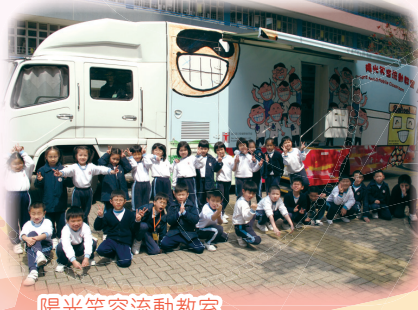
陽光笑容流動教室

高小學生受訓成為「陽光笑容大使」，以朋輩領袖身份向小一至小三同學推行口腔健康活動，鼓勵同學要常常清潔牙齒。