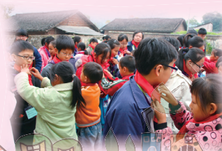
連南山區小學的同學為本校同學戴上紅領巾以示歡迎。