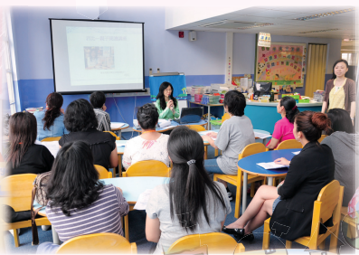
邀請作家君比為家長進行講故事工作坊