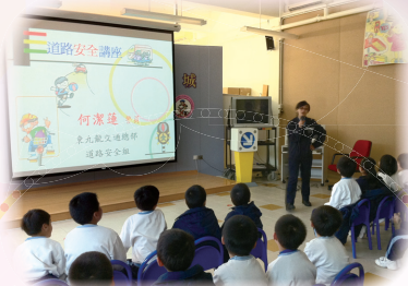
一年級到交通安全城學習安全知識