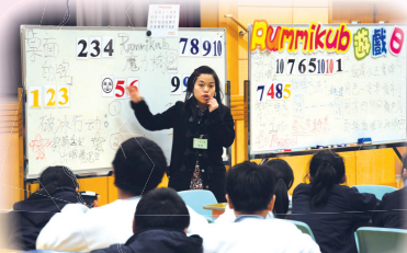
學習世界數學遊戲Rummikub