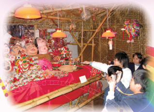
四年級到香港歷史博物館體驗香港昔日情懷