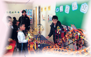
同學利用電腦砌出過山車

為了豐富學生的學習經歷，在1月25至28日期間，學校舉行「秀明至Net的·盡展才能學習周」。同學們經歷漫遊、探索與歷險之旅，盡展個人才能，從中學得開心，學得投入。