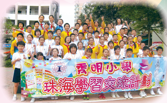
艷陽下，中港兩地師生綻放着燦爛的笑容。