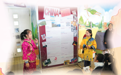
英文「環遊世界」體驗世界各地文化