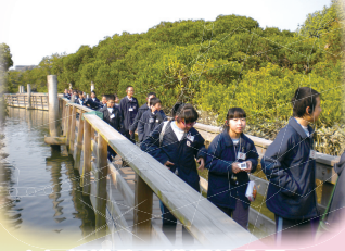
六年級遊覽香港濕地公園