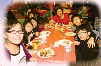
師生共聚，溫情洋溢

「秀明共聚沐春風，桃李滿門蓋天下」為報學校的教導之恩，校友們都回校參與盛事，分享校慶的喜悅。