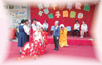
立法會議員黃國健先生蒞臨主禮

秀明小學創校轉瞬已十載，為了慶祝本校10周年校慶，於4月16日舉辦「慶祝10周年校慶」親子同樂日。活動內容豐富，包括節目表演、攤位遊戲、滑梯彈床、電腦機械人遊戲、快樂傘及非洲鼓親子活動，還有學生學習活動的展示等。是日參與活動的學生、校友及家長逾一千多人，眾多來賓出席盛典，一同分享歡樂時光。