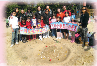
家長和同學們的堆沙作品甚具創意。