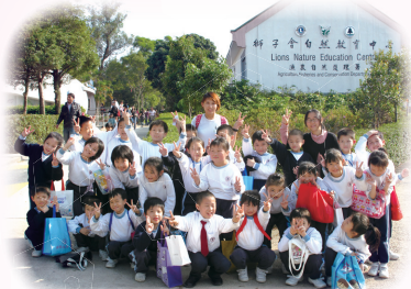
二年級到獅子會自然教育中心認識植物與家禽