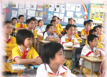
我校同學與珠海學生一起上課。