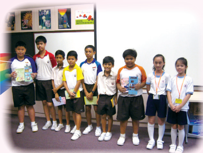
同學們燦爛的笑容，為是次交流劃上完美的句號。

4月21至23日我校30位四年級同學到珠海進行「珠海學習交流計劃」。學生透過一連串的學習體驗，增強學習普通話的信心；與國內優秀學校交流，培養同學良好的學習態度與情操，提高自我要求、獨立自律的品格與自理能力。