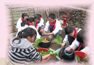
同學們辛勤地參與各項家務，體驗農務生活。