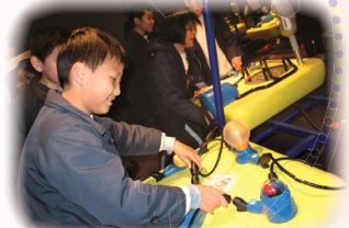
五年級到科學館參與實驗

高年級同學到科學園參加「創新科技節」，當天的活動多采多姿，包括攤位遊戲、講座、試坐未來環保巴士等，同學們都滿載而歸。