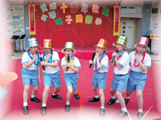
四年級同學英語節目