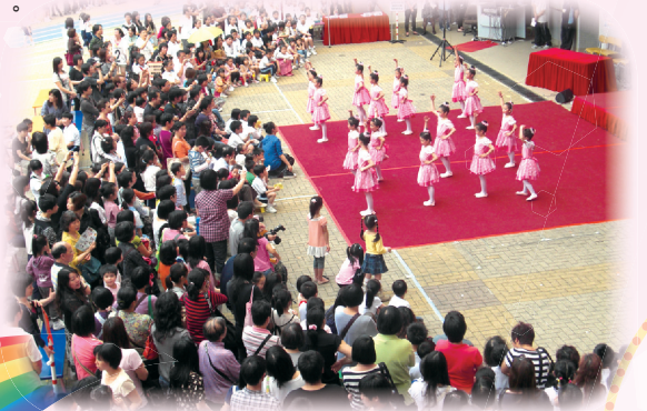
一年級同學舞蹈表演