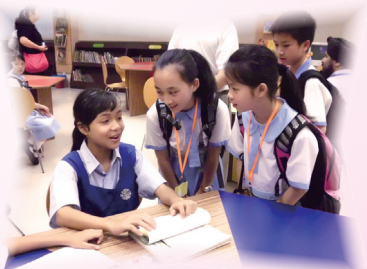
學生們與新加坡的同學談得挺高興呀！