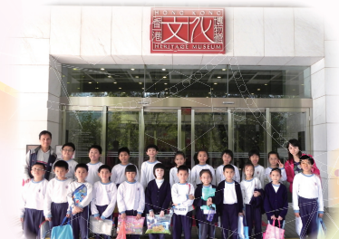
三年級到文化博物館揭開考古的奧秘