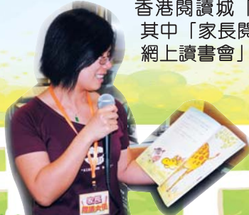
家長在校園廣播中講故事

為了在校園撒下推動閱讀的種子，提升學生的閱讀興趣和校園閱讀風氣，本校成功申請香港閱讀城「悅讀學校」計劃，其中「家長閱讀大使」及「網上讀書會」兩項活動。