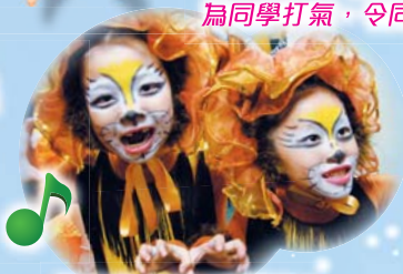
神氣的小獅子出場了！