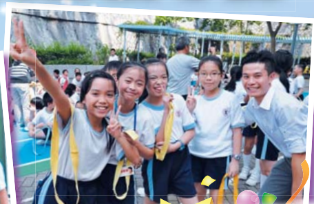
春風化雨十載情 良師育才齊喜慶