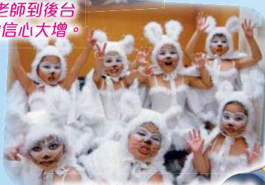
同學們披上舞衣，立即變成活潑可爱的小北極熊。