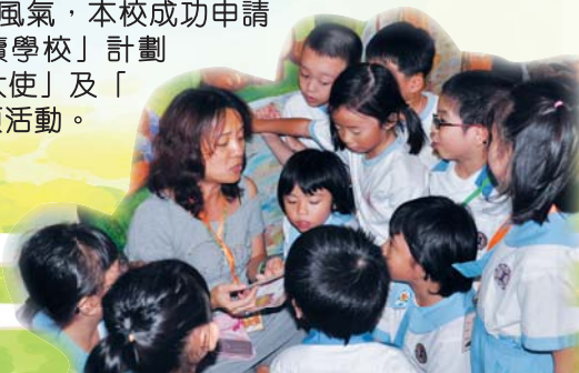
同學聚精匯神地聽故事姨姨講故事