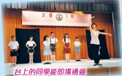
台上的同學能即場通過舞蹈測試，真厲害！