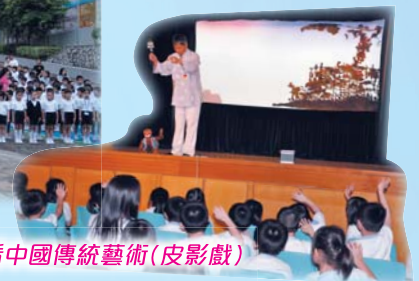
觀看中國傳統藝術(皮影戲)