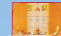
本校獲頒發第十一屆世界華人學生作文大賽的「優秀組織獎」