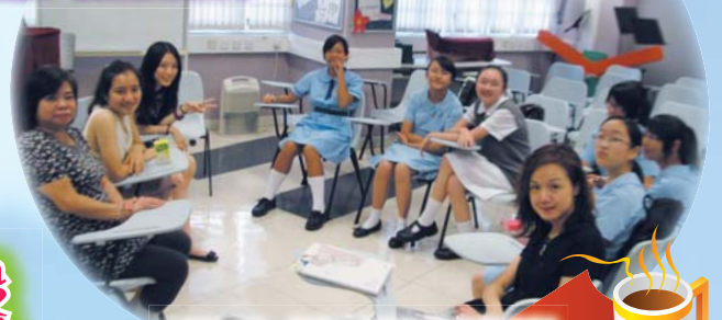
9月24日，校友籌委會代表與老師開會商討校慶工作。

不經不覺，學校已踏入十周年，我們的校友一直對母校及老師有深厚感情，趁着十周年的大日子，校友們會籌備各類活動慶祝，當中包括配合校慶的繪畫及徵文比賽、聚餐及表演等。