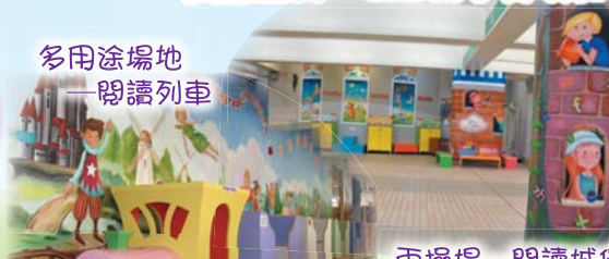
多用途場地 —閱讀列車