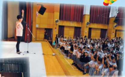
同學正投入地跟着表演嘉賓學習芭蕾舞的基本動作。