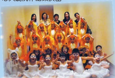
表演前夕，得到學校老師到後台為同學打氣，令同學的信心大增。

本校(09-10)一年級24名同學接受過去一學年的培訓後，於2010年7月17日在香港文化中心大劇院作結業演出。