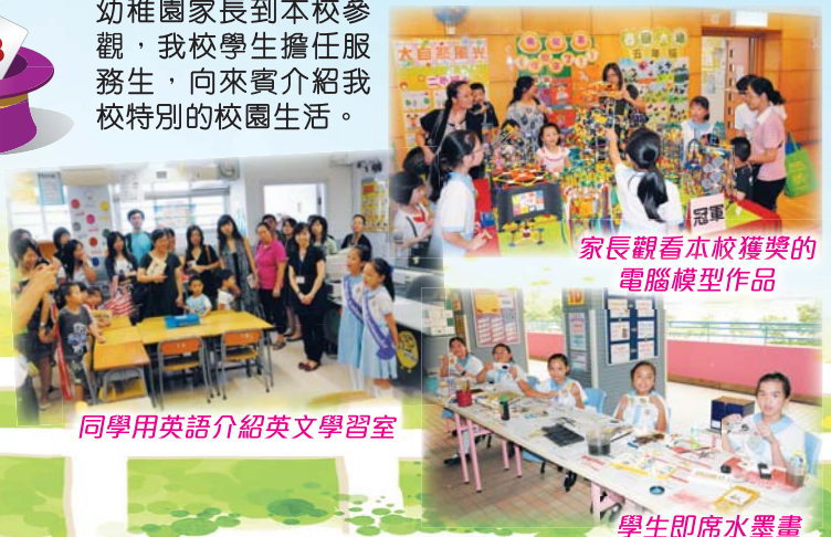
家長觀看本校獲獎的電腦模型作品

9月中，各間觀塘區幼稚園家長到本校參觀，我校學生擔任服務生，向來賓介紹我校特別的校園生活。