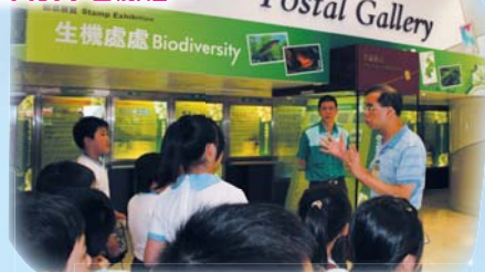
此行讓同學們更了解郵政工作。