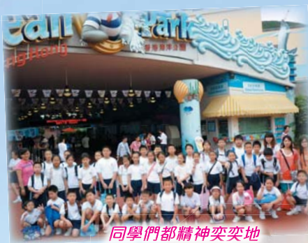
同學們都精神奕奕地準備今天的學習旅程。

7月9日為我校的戶外學習日，當天同學們分別到海洋公園、迪士尼樂園及中環郵政局參加不同主題的活動學習，同學們表現積極，獲益不少。