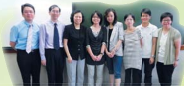
卓校長連同五位班主任於分享會後與教育局有關人員合照。

本校五、六年級參加了教育局訓輔組的班級經營，透過與學生展開班會議，為學生提供發表意見及作決策的機會，從而養成約束自己、尊重別人的精神，並增強他們對班的歸屬感。8月27日五位班主任老師獲班主任工作研究會邀請，與校外同工分享計劃成效。