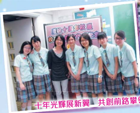
十年光輝展新翼 共創前路攀領域

我們期望，與家長建立緊密的關係，孩子能立足香港，面向祖國，放眼世界，為將來的學習奠定良好的基礎。