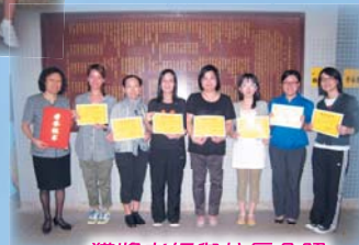
獲獎老師與校長合照