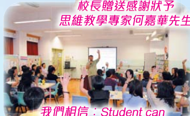
我們相信：Student can think better than what we expect.