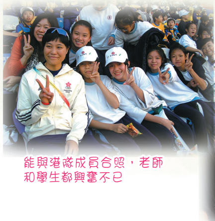
能與港隊成員合照，老師和學生都興奮不已