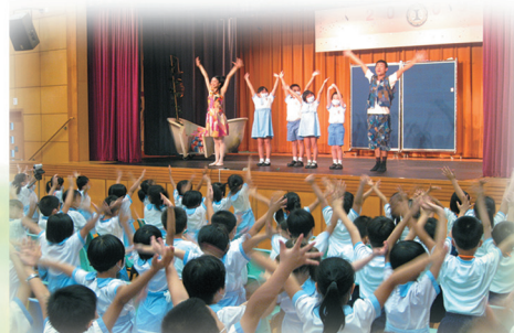
香港芭蕾舞團到校為同學作舞蹈導賞演出。