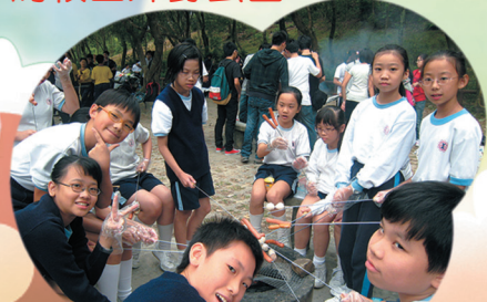
美味的食物真的令人垂涎三尺。