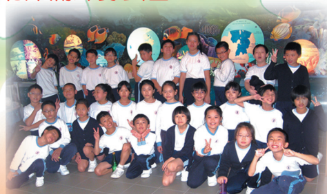
參觀展館後，同學們來一個精靈有趣的大合照。