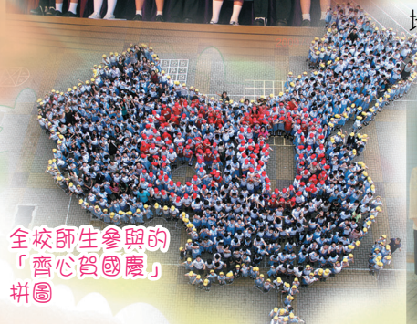
全校師生參與的「齊心賀國慶」拼圖