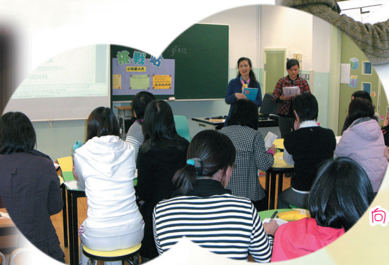
向外校教師介紹本校經驗