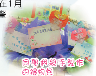
同學們親手製作的禮物包

15名秀明義工大使在1月9日，到了東華三院方肇彝長者鄰舍中心探訪長者，向他們表演節目，與他們一同玩遊戲、及吃茶點及閒聊，並致送親手製作的禮物包給每位長者，同度一個愉快和有意義的上午！