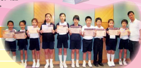
得獎同學與老師合照