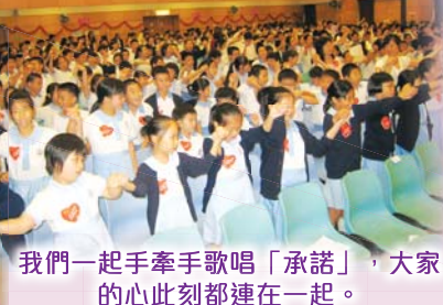
我們一手牽手歌唱「承諾」，大家的心此刻都連在一起。