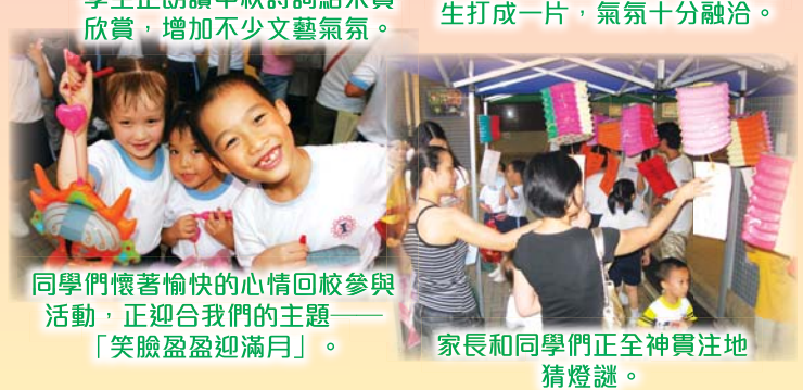
同學們懷著愉快的心情回校參與活動，正迎合我們的主題——「笑臉盈盈迎滿月」。