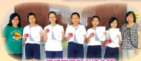
得獎同學與老師合照

我校同學參加了由防止青少年吸煙委員會主辦的「無煙創意工程徵文比賽」，多位同學獲得優異獎。