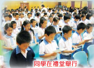
同學在禮堂舉行「我的承諾」宣誓儀式