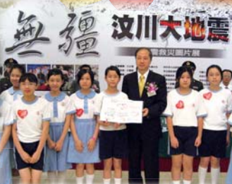
「大愛無疆汶川地震第一線報告」活動。