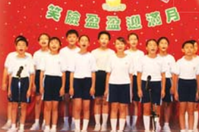
學生正朗誦中秋詩詞給來賓欣賞，增加不少文藝氣氛。