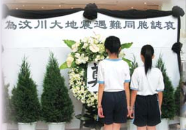
為汶川大地震遇難同胞誌哀。