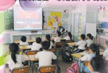
看！同學們正聚精會神地觀看「我是中國人」的短片。