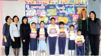
最積極參與的班別均獲獎品以示鼓勵