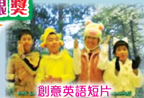
創意英語短片 The most powerful force