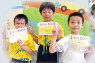
同學把目標寫在承諾書上

同學藉著參與集體的承諾，在學校、家庭實踐他們的承諾內容，身體力行去建立健康的生活方式及積極的人生。