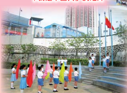
五星紅旗隨風飄揚，多麼令人振奮！