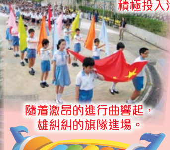
隨着激昂的進行曲響起，雄糾糾的旗隊進場。