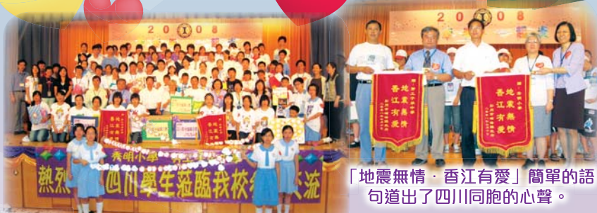
四川學生與我校同學大合照。