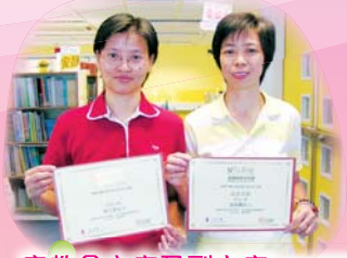
家教會主席及副主席 代表獲此獎項

我校師生及家長積極參與由衛生署舉辦的健康飲食在校園活動，為學生舉辦了一系列與健康飲食有關的活動，榮獲校園至「營」特工計劃金獎。本年度我校繼續參加上述計劃，藉此培養學生養成良好的飲食習慣。