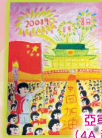
亞軍作品 (4A 黃樂德)