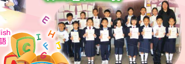
英文書法比賽得獎同學合照