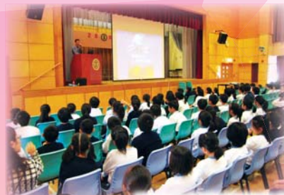
正確使用互聯網講座