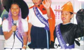
英語大使扮鬼扮馬宣傳English Week的活動，多吸引啊!