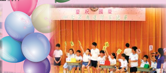
2008北京奧運問答比賽，同學們積極投入活動，踴躍作答，真厲害！