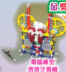
電腦模型 擠擠牙膏機