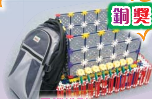
電腦模型 書包減磅指示器