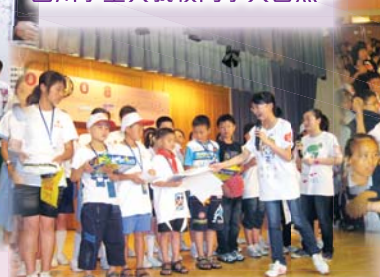
四川學生接到我們精心設計的禮物及慰問卡，心情十分激動。