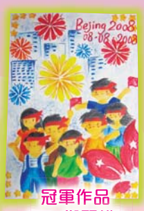
冠軍作品 (6A 鄭麗樺)