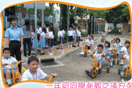
一年級同學參觀交通安全城