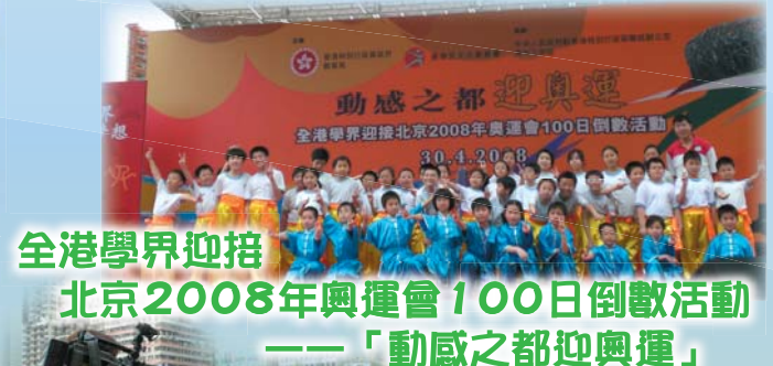
全港學界迎接北京2008年奧運會100日倒數活動——「動感之都迎奧運」