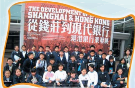
四年級同學參觀香港歷史博物館