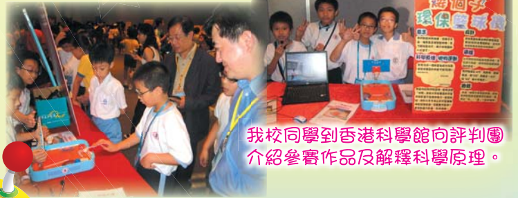
我校同學到香港科學館向評判團介紹參賽作品及解釋科學原理。

科學及科技教育是本年度學校發展重點之一，亦是我們優質教育基金計劃中的目標。因此同學們都積極參與校外比賽，更有部份作品於大型活動中展出。