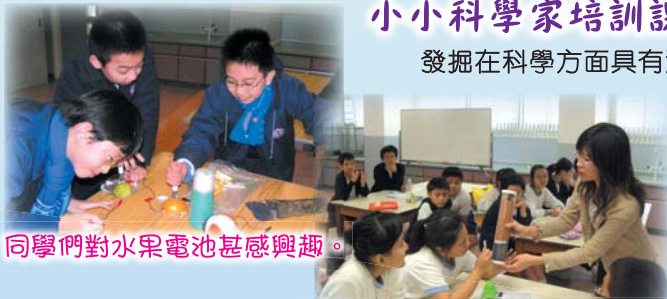
同學們對水果電池甚感興趣。

發掘在科學方面具有潛質的學生，增加他們認識科學與科技的機會，並培養學生的探究精神及發展各種共通能力。