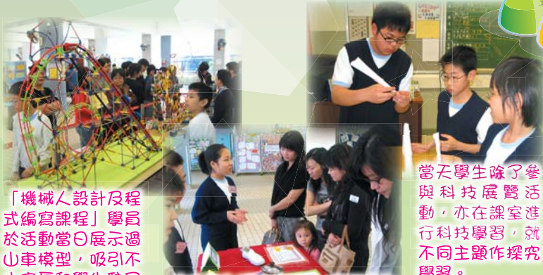
「機械人設計及程式編寫課程」學員於活動當日展示過山車模型，吸引不少家長和學生駐足觀賞。

科技展當天學校開放課堂，讓家長進入課室觀課，了解子女的學習情況，參與觀課的家長近百人，氣氛熱烈。