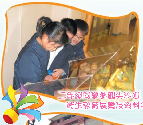
二年級同學參觀尖沙咀衛生教育展覽及資料中心