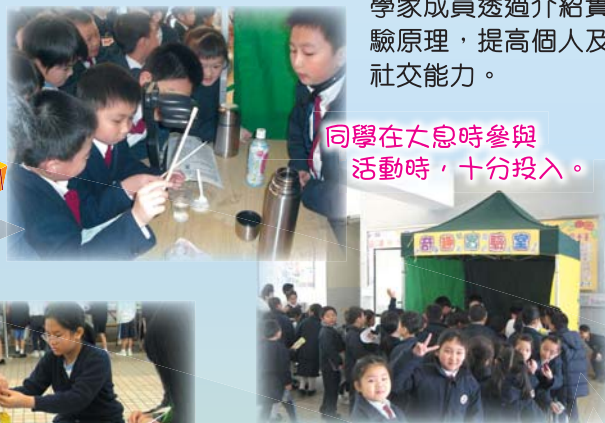
同學在大息時參與活動時，十分投入。

提昇所有學生對科學及科技方面的興趣和知識，並讓小小科學家成員透過介紹實驗原理，提高個人及社交能力。