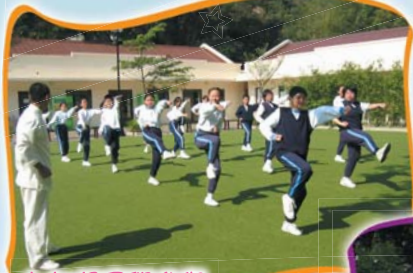
六年級同學參與少林武術中心日營