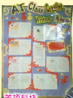
英語科技 創意寫作