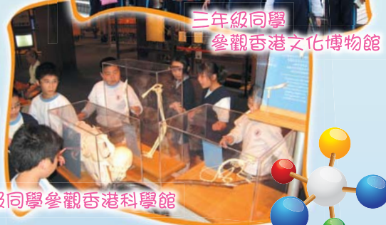
五年級同學參觀香港科學館