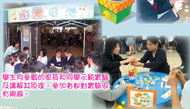
學生向參觀的家長和同學示範實驗及講解其原理。參加者對實驗很有興趣。

4月25日舉行科技展覽暨教學展示活動，活動內容豐富，除展出學生自行創作的科技產品、「寫出新科技」寫作比賽優勝作品、科幻畫作、科技新知外，還於場內設置互動的「奇趣實驗室」，由「秀明小小科學家」示範及講解實驗的原理和過程，家長及同學均可參與試作。此外如欲一嘗發明的樂趣，亦可參與「科學手工DIY」活動，發揮創意。