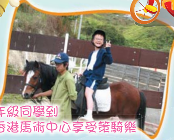
四年級同學到香港馬術中心享受策騎樂