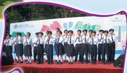
紅十字會隊員獲邀演出「人道」凝聚東九龍之和諧社區在觀塘」活動，用手語演繹歌曲——《生命有價》。