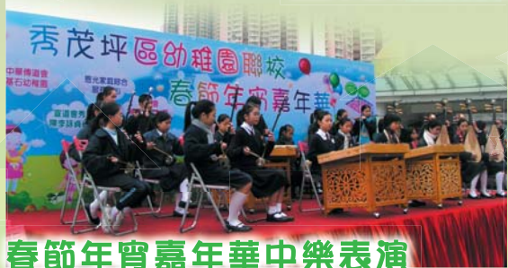
春節年宵嘉年華中樂表演