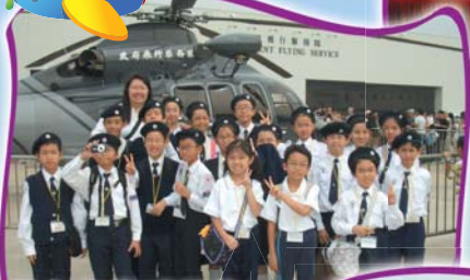
紅十字會隊員參觀政府飛行服務隊開放日，團員及家長均讚賞當天飛行服務隊的飛行表演，令人嘆為觀止。