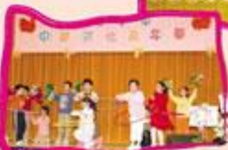
你跳我跳齊齊跳，身體健康好重要。