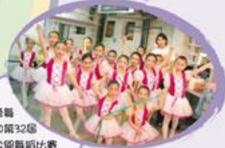
芭蕾舞組參加第32屆全港公開舞蹈比賽獲銅獎。