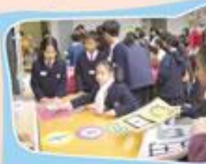
攤位遊戲吸引不少參加者，看，熱鬧嗎？