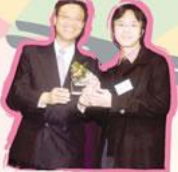
學校代表與頒獎嘉賓合照

我校同學於04年參與由香港吸煙與健康委員會舉辦的無煙特工隊訓練計劃，並獲最踴躍參與學校大獎。