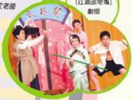
得獎戲劇「江湖話嘅嗰」劇照