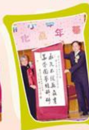
校董、校長陪同主禮嘉賓主持點睛儀式。