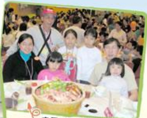
家長享用豐富盆菜宴