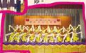
舞蹈組同學表演西藏舞，舞姿美妙。