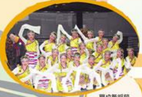
學校舞蹈節比賽中，得獎同學與老師合照。