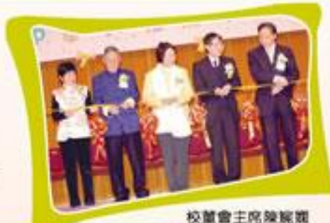
校董會主席陳婉嫻女士及校董、校長陪同主禮嘉賓余志福太平紳士(右二)及中聯辦教科部副部長潘永華先生(右一)主持剪綵。