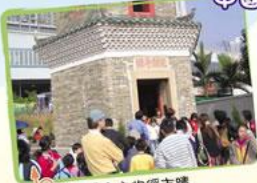
參觀屏山文物徑古蹟