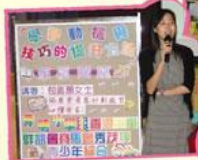
2004年11月3日「學習動機與技巧的提升方法」家長講座