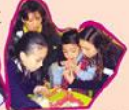
在小導師指導下，小朋友成功地黏紙草蠶。