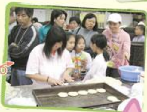
參觀恆香老婆餅廠