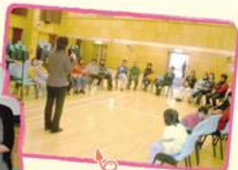
2005年3月16日「與你同行」家長小組(情緒篇)