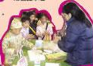
家長義工協助同學以麵粉黏土捏出白兔，做出蟲蟲……。