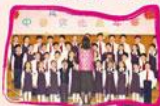
同學們的表演，贏得不少掌聲。