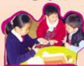
小導師專心示範剪紙，同學們興趣盎然。