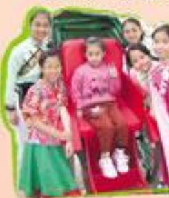
古代的裝扮，現代的人物，你認得我嗎？