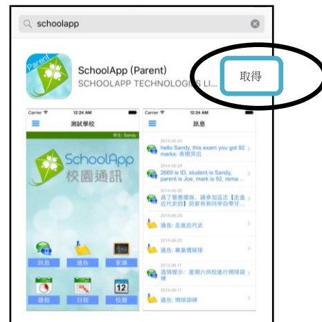
Apple App Store