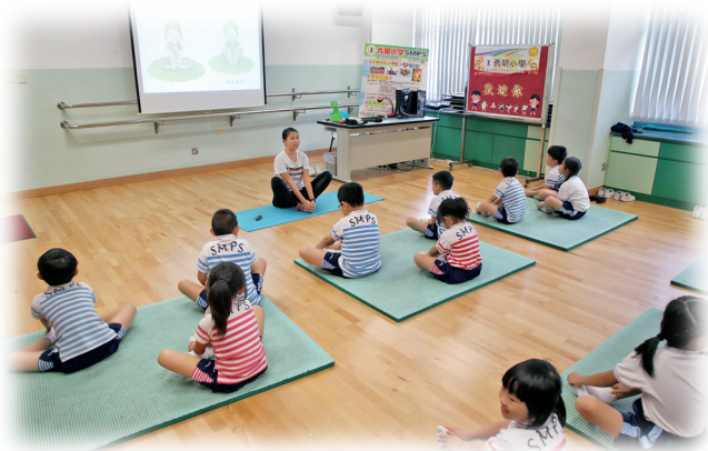
▲與體育科協作，推動跨課程閱讀。

「校本童書課程」是我們教師團隊歷時十年規劃的閱讀課程。童書，是我們在學生身上播下的種子。由萌芽到探索，由逐步發展至漸趨成熟；以閱讀教學為起點，再延伸至寫作、品德情意等學習範疇，甚至是跨學科課程規劃。我們通過開放式的選材及系統化的閱讀模式，提升學生閱讀深度，拉闊思考空間，養成良好品格。