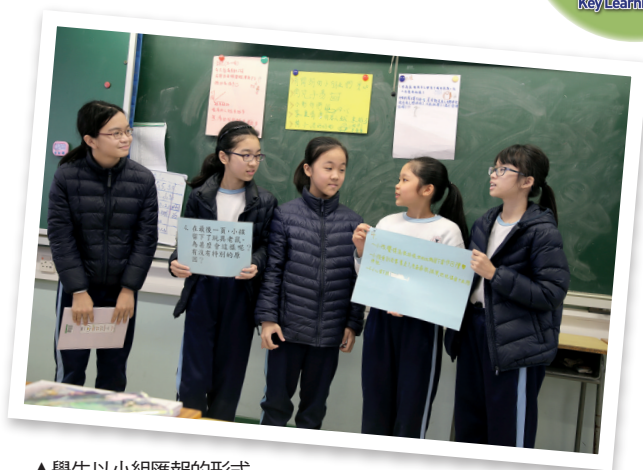
▲學生以小組匯報的形式與同儕分享閱讀感受