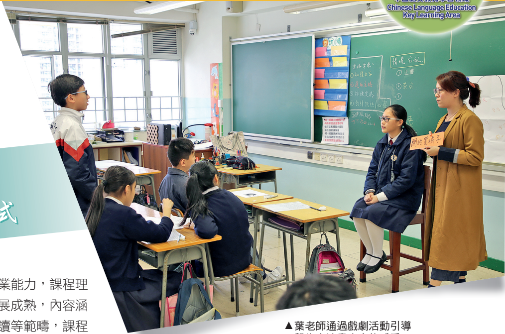
▲葉老師通過戲劇活動引導學生表達書中人物感受

觀課所見，「童書」選材恰當，能切合學生的興趣和能力，教學設計能落實 TiPS 閱讀教學模式，組織嚴密，學生的課堂參與度高，踴躍回答問題，能從閱讀中展現正面的價值觀，教學效果良好。小組教師的教學基本功扎實，教學表現優秀，課堂節奏控制得當，能夠維持濃厚的學習氣氛，提問和回饋的技巧俱佳，能夠照顧學生的多樣性。