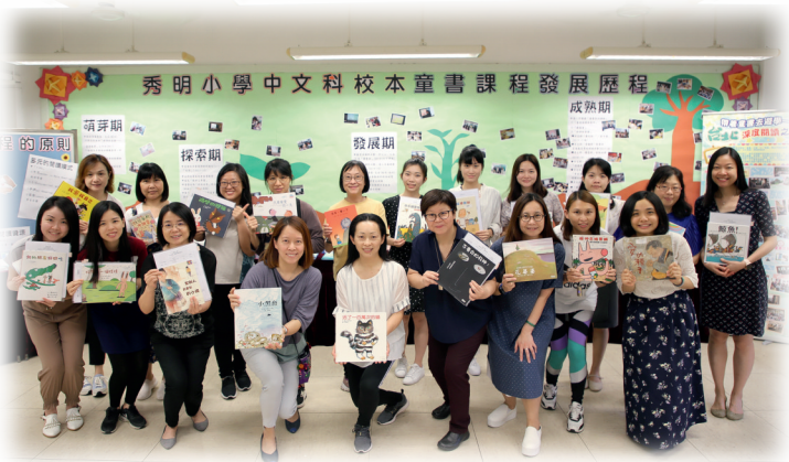
▲十年耕耘，樹木樹人。

十年耕耘，果實纍纍。學校的風景變得不一樣了——我們案頭上的童書比教科書多，學生拿着童書讀得津津有味，師生為了交流閱讀所得，渾然不覺小息鐘聲已響起……我們所收穫的已不只是豐富而堅實的校本課程，師生分享的也不單是書本內容，還有真情、良善和美德。期盼我們在學子心中埋下的小種子能繼續生根發芽，為稚嫩的心靈結好一張溫柔的網，伴隨他們健康成長。