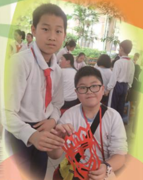
與當地學生進行文化交流