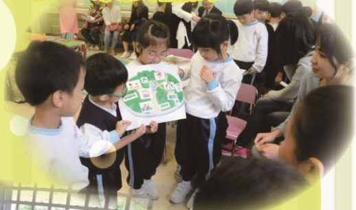
課堂活潑有趣，學生專注投入。