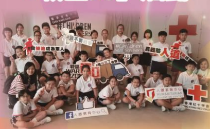
讓學生了解戰爭的禍害