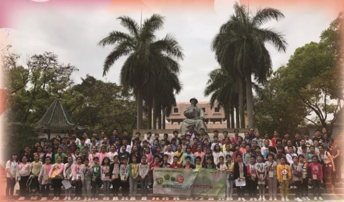
認識鴉片戰爭歷史

五年級學生參加同根同心 — 內地交流計劃，到中山及東莞進行學習活動，增加對近代史的認識。