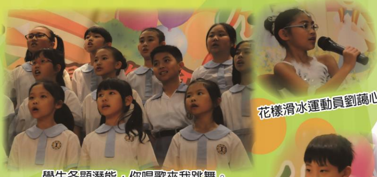
花樣滑冰運動員劉諤心