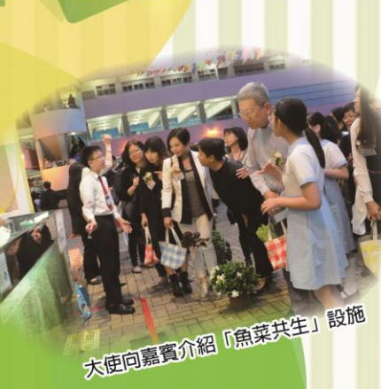
大使向嘉賓介紹「魚菜共生」設施

轉眼間，秀明小學已建校十六年了。本校積極讓學生藉著服務學習培養正面價值觀，透過體藝學習的經歷展現自信，使學生發展所長，為品格及學業奠定良好的基礎。