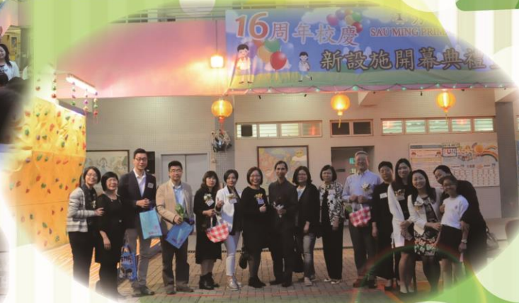
主禮嘉賓於新設施「魚菜共生」系統及攀石牆旁合照留念