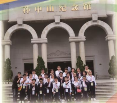
了解孫中山先生的事跡