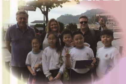
到赤柱與遊客英語訪談