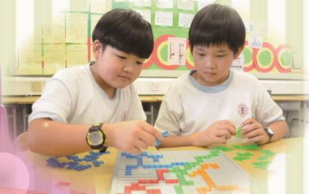
專注地進行數學活動