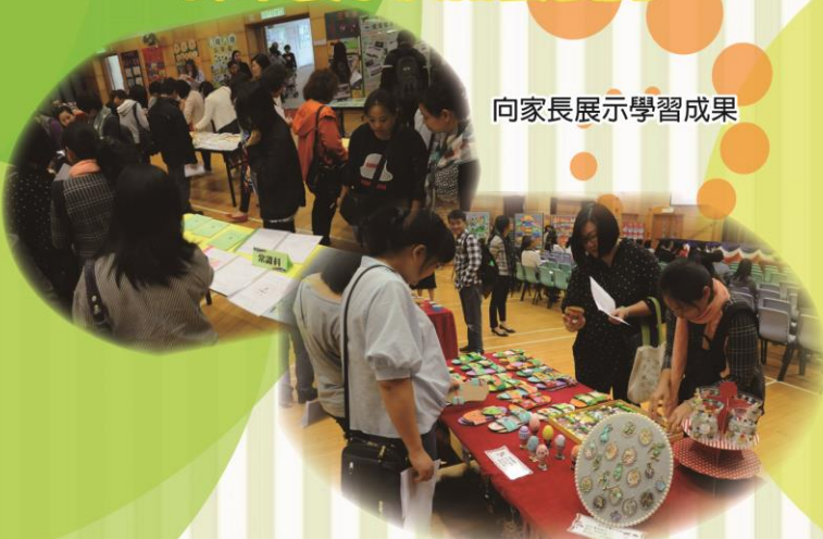
向家長展示學習成果