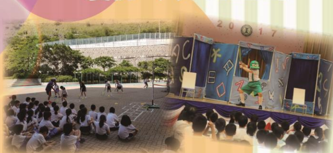
學生於兒童節參與網球、跳繩及話劇欣賞等活動。