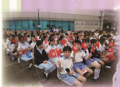
學生到金紫荊廣場出席升旗禮