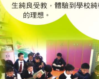
▲ 一年級學生的活動場地