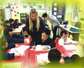
▲ 外籍教師與同學一起進行「Bridging class」