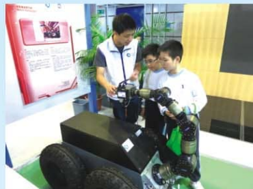
▲ 同學招觸移動機械臂系統

同學到香港科學園參加創新科技嘉年華活動，認識本港大學及科研機構的尖端發明，感受優秀的香港創意潮流，培養無盡的創意。