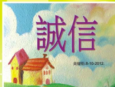
▲ 加強價值教育的校本德育課程