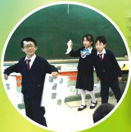
▲ 提升教學效能的戲劇教學