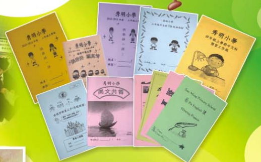
▲ 強化學習效能的校本課業