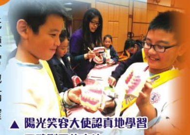
▲陽光笑容大使認真地學習正確刷牙的方法

四、五年級的「陽光笑容大使」參與領袖訓練工作坊，學習口腔健康常識及正確刷牙的方法，他們還協助推行陽光笑容滿校園活動，教導同學正確的刷牙方法。