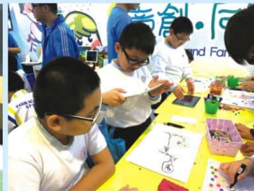
▲ 同學正投入參與科技學習活動