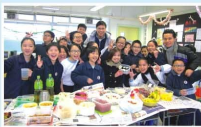
◀「秀明綠色聖誕班」班際智激鬥比賽

聖誕聯歡會時，環保組老師及環保大使呼籲同學帶適量及健康的食物，減少廚餘，並自備餐具享用食品。