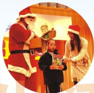
▲聖誕老人抽獎大派禮物，為節目增添歡樂氣氛。