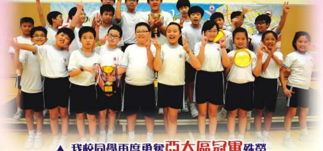
▲ 我校同學再度勇奪亞太區冠軍殊榮

THE HONG KONG POLYTECHNIC UNIVERSITY 香港理工大學