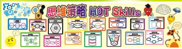
▲ 發展思維的「思維策略15式」於全校施行