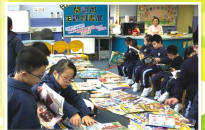
▲ 學校定期舉行的主題閱讀活動