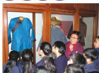
同學們靜心聆聽導賞員詳細的講解