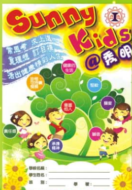
▲ 關注學生行為的輔導獎勵計劃