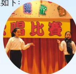
▲ 同學在舞台上載歌載舞，台風十足。