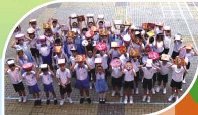
▲「月餅罐環保回收」比賽

我校於中秋節後舉行「月餅罐環保回收」比賽，各班同學積極參與，今年總共收集到九百多個罐，打破舊記錄。