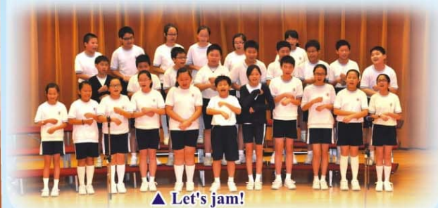
▲ Let's jam!