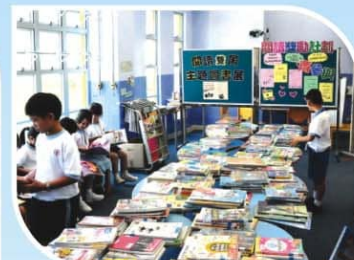
▲ 同學到圖書館參與書展