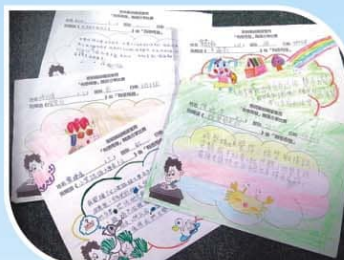
▲ 「有感而發」閱讀分享比賽作品

閱讀雙周為同學舉辦多項閱讀活動，包括閱讀大使講故事、「我的『悅』讀分享」、主題書展及「有感而發」閱讀分享比賽等，讓同學擴闊視野、增廣見聞。