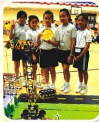
▲ 最具功能獎—— 多功能貨運碼頭