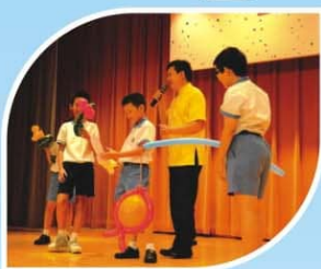
▲ 同學獲邀參與表演雜耍