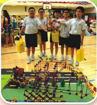
▲ 冠軍——智能運輸系統

於2013年7月舉辦的2013國際K*bot亞太區大賽主題為「智能運輸系統」，同學們的創意及發明意念能實踐並融入生活當中。最後我校同學獲多個獎項：