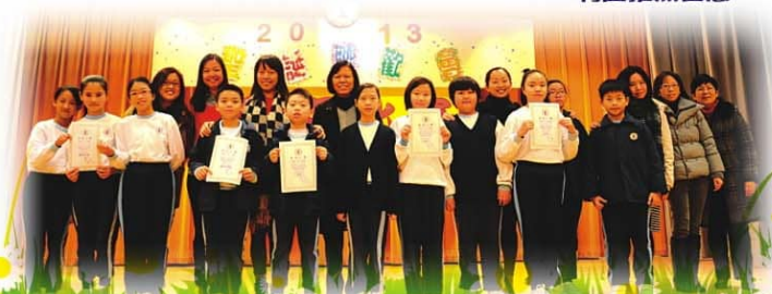
▼ 比賽完滿結束，各參賽同學與評判團拍照留念。