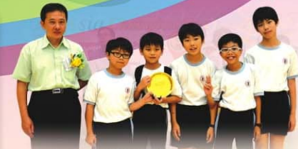
▲ 獲小學常規組嘉許獎同學